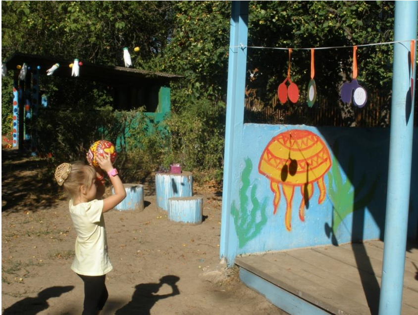
«Попади в цель»