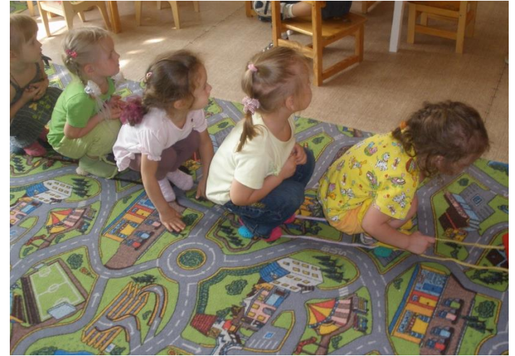
Дорожка для прыжков