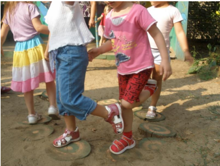
Прыжковые деревянные плашки