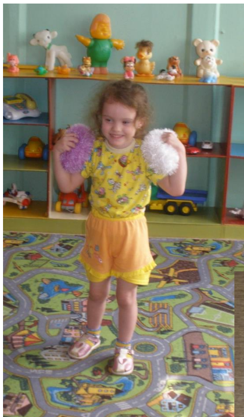
Мячики - мякиши