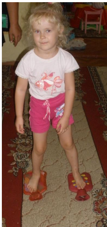
Грелки - балансиры