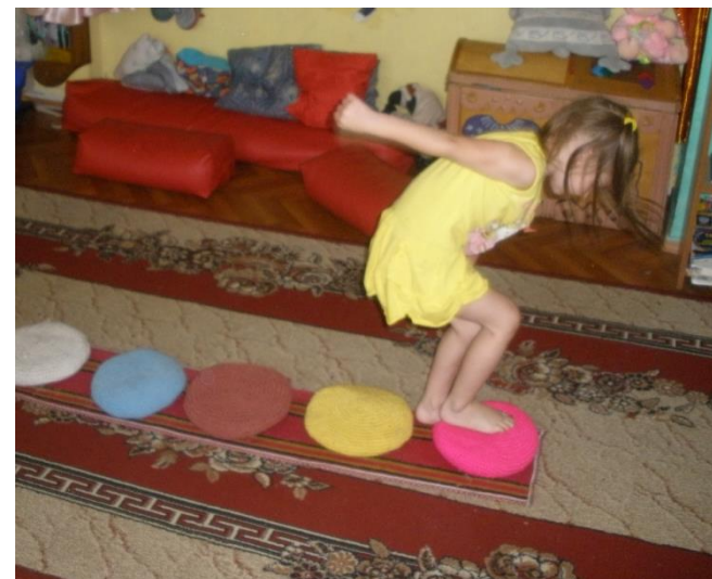
Подушки на липучках