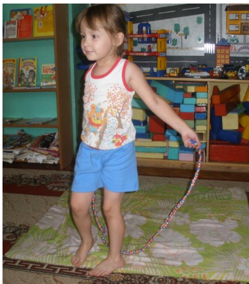
Плетеные цветные веревочки