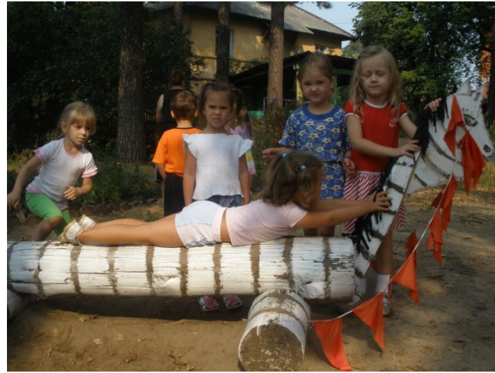
Полифункциональный тренажер «Зебра»