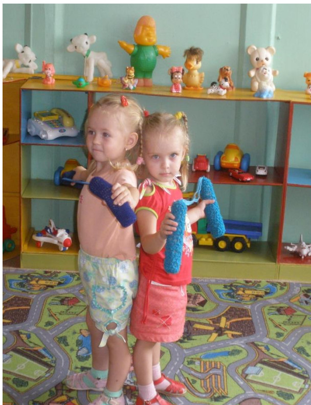
Эспандер для малышей